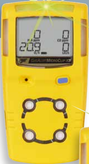
GasAlert MicroClip X3

El funcionamiento está garantizado durante todo el turno, incluso en condiciones climáticas adversas.