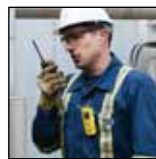
Fácil de utilizar