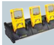
Base de carga múltiple (cinco unidades)

Si desea conocer la lista completa de accesorios, póngase en contacto con BW Technologies by Honeywell.