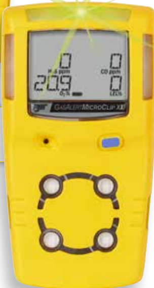
GasAlert MicroClip XL

¡NUEVO! GasAlertMicroClip X3 y GasAlertMicroClip XL cuentan ahora con la clasificación IP68 para obtener una protección máxima contra el polvo y el agua (de hasta 45 minutos a una profundidad de 1,2 m).