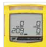
Fácil de leer