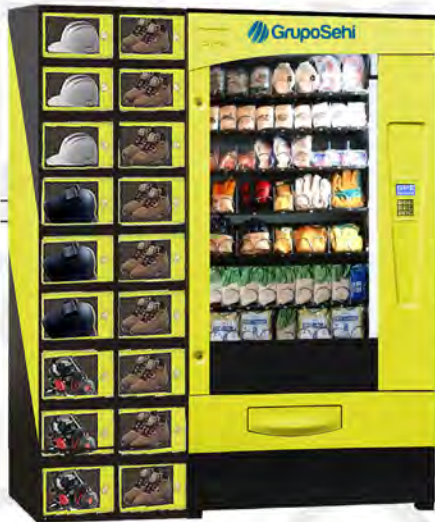
Medidas EPI 50 + EPI BOX 18. ancho 165 cm, fondo 85 cm, alto 205 cm.